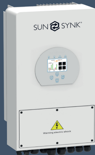
3 Phasen Inverter 8kW (SUNSYNK-8K-SG04LP3) 3 Phasen Inverter 10kW (SUNSYNK-10K-SG04LP3) 3 Phasen Inverter 12kW (SUNSYNK-12K-SG04LP3)