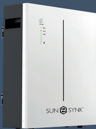
Batterie für Wandmontage (SUN-BATT-5.12)