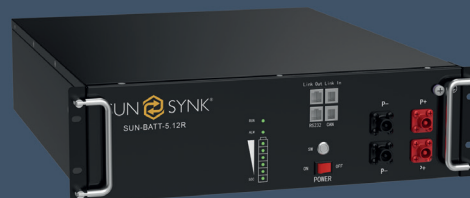
Batterie für Rackmontage (SUN-BATT-5.32R)